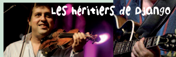
LES héritiers de Django

Ces deux-là sont d'immenses musiciens. L'un tire l'archet, l'autre gratte les cordes. Mais ils sont nourris de la même culture gitane et partagent le même sens du swing. Chacun interprétera son propre programme, puis ils se rejoindront pour une prestation commune toute en complicité.