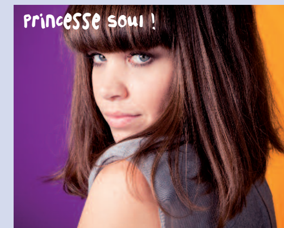
Princesse soul !

Les partenaires : Bergeret, Ronce Immobilier, Cabinet Brosset, Crédit Mutuel, EDF, Marceul Réceptions, Sogea