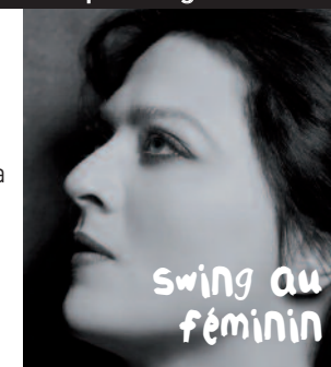
swing au féminin

Les partenaires : Astec, Eiffage TP, Eiffage Energie Sita, SNCF, JFC