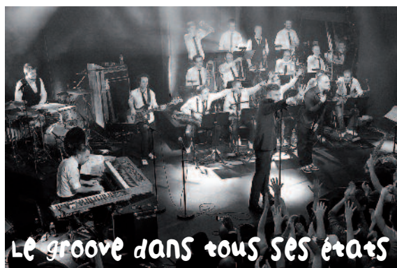
Le groove dans tous ses états

Les partenaires : Bouygues Telecom, Ronce Immobilier, Cabinet Brosset, Grandes Etapes Françaises, La Bulle Verte, Vinci Energies