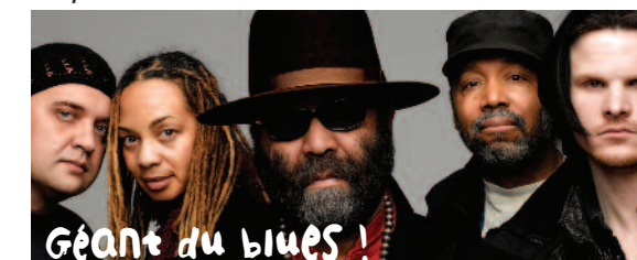
Géant du blues !